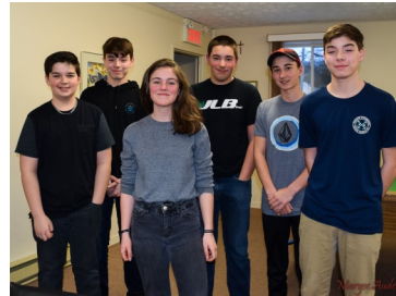
Les jeunes qui s'impliquent