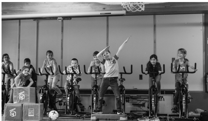
À Saint-Malo, les enfants du service de garde bougent au cube grâce à leurs nouveaux équipements sportifs.