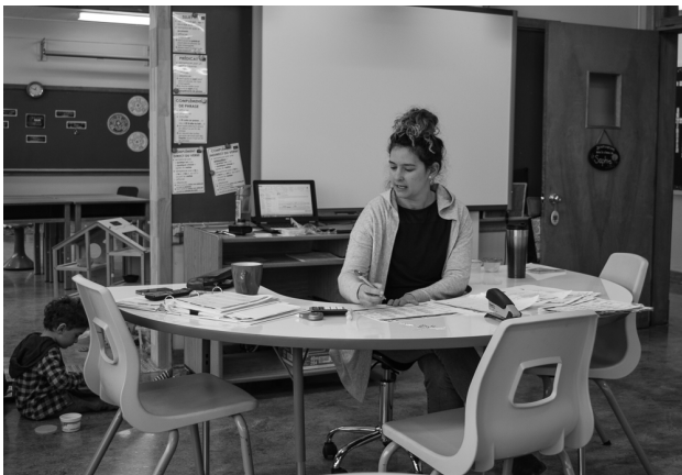
Table de travail contemporaine en forme de demi-lune

Afin d'enrichir toute cette offre, l'école a aussi fait l'achat de 10 vélos de « spinning » qui sont installés sur le théâtre de l'école de Saint-Malo.