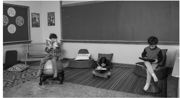
Classe évolutive avec mobilier flexible

Du nouveau mobilier a également fait son apparition dans les classes. Une salle de classe évolutive permet de capter naturellement et plus efficacement l'attention des élèves.