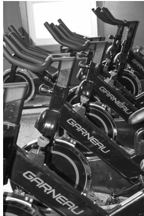
Vélos de « spinning » Garneau