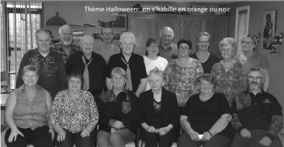
Thème Halloween: on s'habille en orange ou noir

Votre lieu, vos idées, vos ACTIVITÉS HIVER 2019