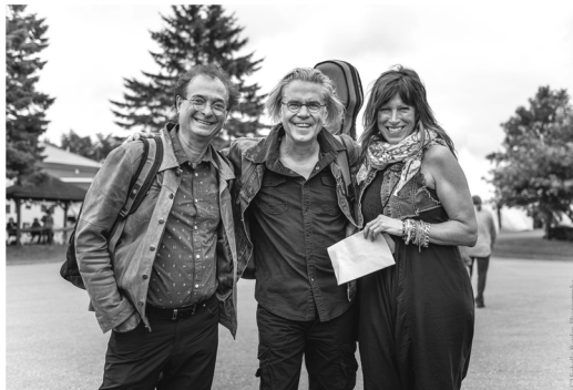
Normand Baillargeon, Richard Séguin et Luce Dufault