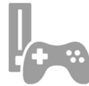
Consoles de jeux vidéo