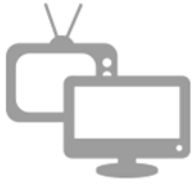
Téléviseurs et écrans