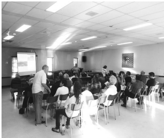
AGA de Forêt Hereford, 20 juin 2017

chasse au cerf de Virginie, à l'original, au dindon sauvage, à l'ours et au petit gibier, en plus de l'offre de pêche en ruisseaux et en rivière. Forêt Hereford soutient le Club de différentes façons pour le développement de cette forme d'accessibilité. De plus, des périodes de fermeture du territoire sont prévues à chaque année pour permettre la cohabitation de cette activité avec les autres usagers de la Forêt. Aussi, différentes approches sont développées pour favoriser le recrutement et la relève chez les jeunes chasseurs. Pour les intéressés, il reste encore quelques places de disponibles pour la chasse 2017, hâtez-vous !