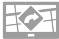
Systèmes de localisation