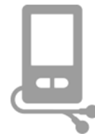
Lecteurs audio/vidéo portables

Points de dépôt : PC. Expert, Mégaburo Coaticook, Brunelle Électronique, Ressourcerie des Frontières, Écocentre RIGDCS (site d'enfouissement)