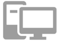
Ordinateurs de bureau