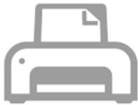
Imprimantes et numériseurs