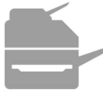
Photocopieurs et télécopieurs