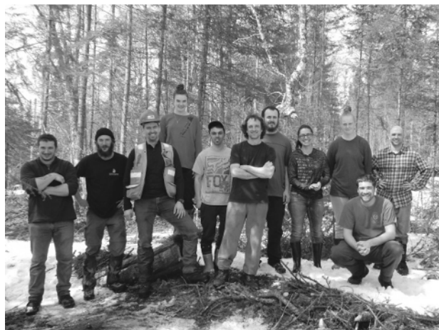
Visite, dans la Forêt Hereford, en avril 2017, d'élèves en foresterie du Centre de formation professionnel le Granit.

participé à cette démarche, dont le résultat final sera présenté à l'assemblée générale annuelle de Forêt Hereford, prévue le mardi 20 juin 19 h, au Centre communautaire de Saint-Herménégilde. Cette démarche permet de réfléchir au développement acéricole, aux superficies en zone de crédits carbone, aux zones prioritaires pour la faune, aux développements récréatifs futurs, à la mise en valeur des paysages, etc.